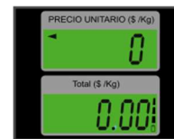
Pantallas de cuarzo con iluminación (backlight)