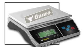
Incluye mica protectora