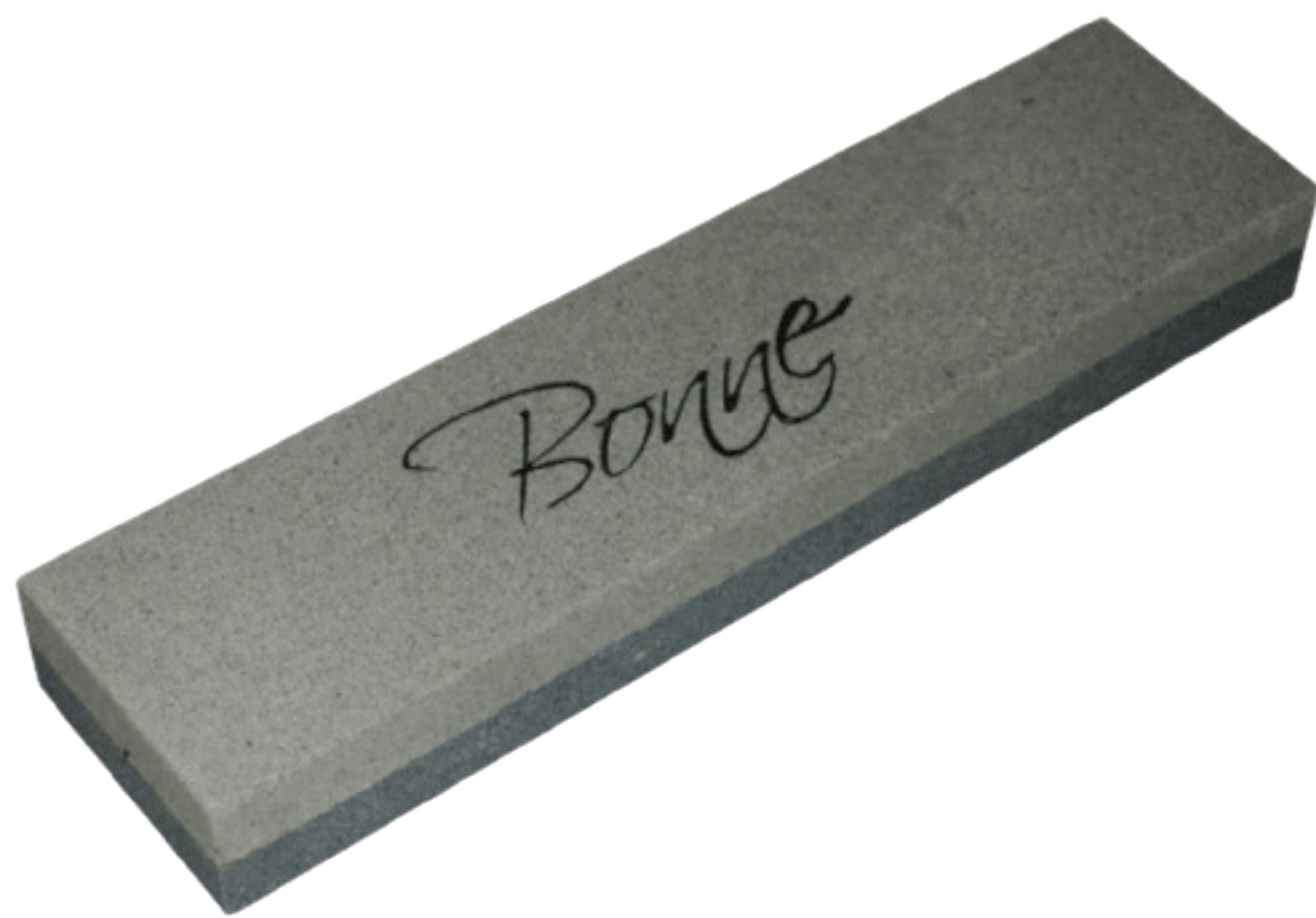
Piedra de afilar